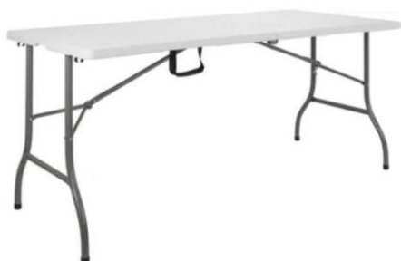
Mesa plegable superficie plastica con base metálica 1,80x72x 73 alt