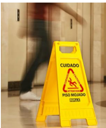
Señal de piso húmedo, advertencia clara y visible para evitar accidentes, en espacios interiores y exteriores.