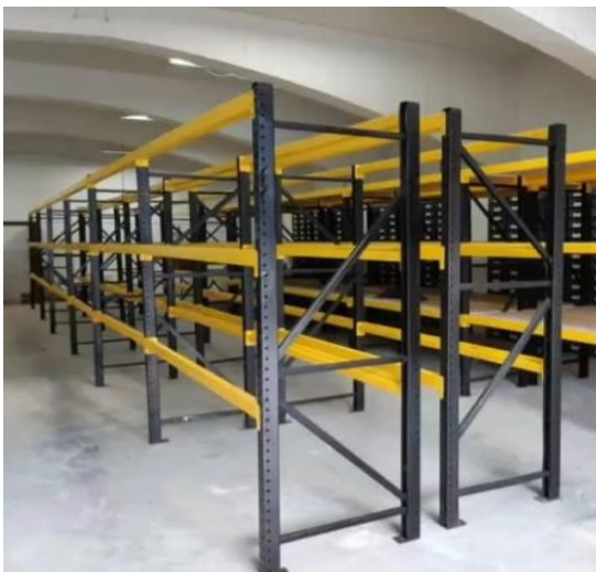
Estanteria metálica semi pesada de ensamble con perforación aguacate, terminada en pintura electrostática. Color a convenir.